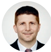
Rudolf Bruder Servizio alla clientela e Prestazioni